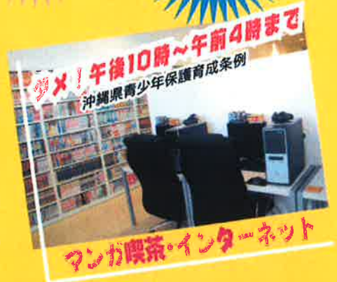
マンガ喫茶・インターネット

そのほか、深夜営業のコンビニ、飲食店を含め、全ての県民には青少年の深夜のはいかないを防止する努力義務があります。