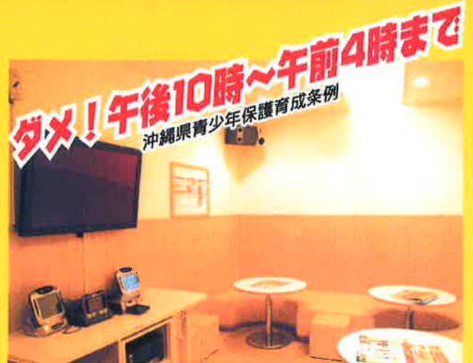
カラオケボックス