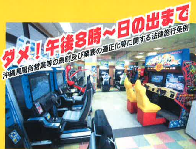
ゲームセンター ※一部は午後10時~午前4時まで

※興行場等とは、映画館、演劇場、ボウリング場、ビリヤード場、スケート場、ゲームセンター、カラオケボックス、インターネットカフェ、マンガ喫茶などをいいます。