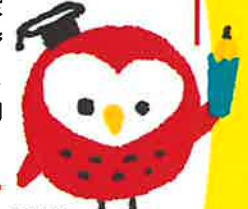
就学援助 イメージキャラクター ツクロウくん

学校教育法などにもとづいて、小中学校の子どもがいる家庭に学用品費や学校給食費などを市町村が援助する制度です。子どもたちの安心して楽しい学校生活のために、気軽に就学援助制度を活用してみませんか。