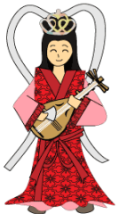
弁財天 水と・芸能（音 楽・知恵）を もたらす神さま