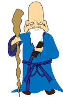
福祿寿 不老長寿の （長生き）神 さま