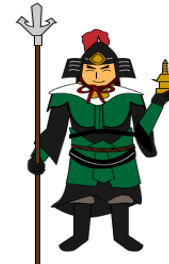
毘沙門天 富と勇気・闘 いの神さま