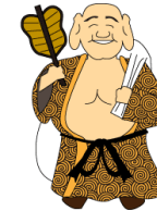
布袋 未来を予知 する金運の 神さま