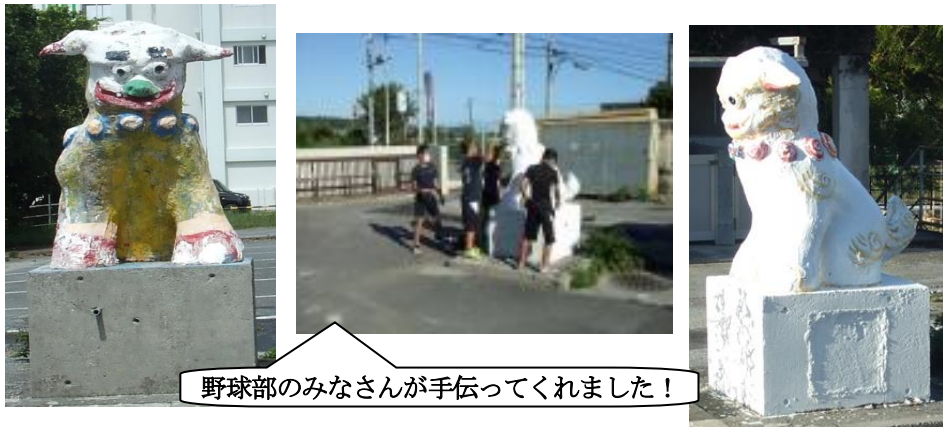
野球部のみなさんが手伝ってくれました!