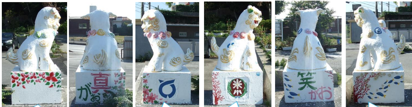
糸満市の花木 ブーゲンビリア