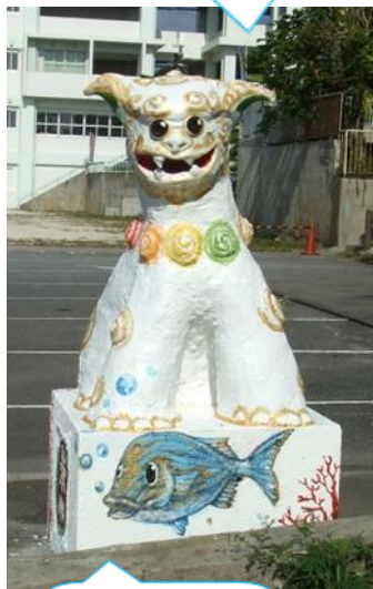
糸満市の魚 タマン

※ 模様や配色 案 2年生15名 合作 2年生の全員が、シーサーの模様や配色を 考えてくれました。それぞれの案を合わせて 模様や配色を決めました。