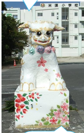
糸満市の花 日日草