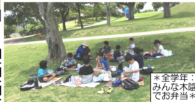
*全学年:みんな木陰でお弁当*