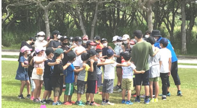
*1年と6年合同:じゃんけん列車*