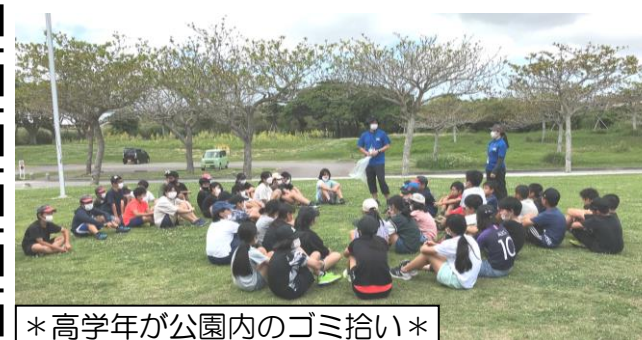
*高学年が公園内のゴミ拾い*