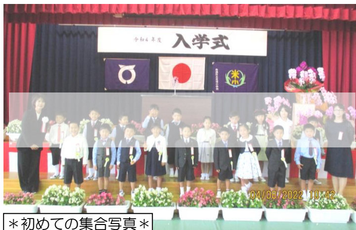
*初めての集合写真*