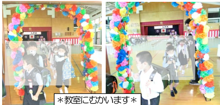
*教室にむかいます*

今週で4月も終わります。学習や友達、遠足など学校の様子を、1年生が毎日、お家の人に楽しく伝えられていたら嬉しいです。