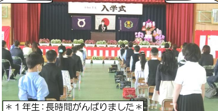
*1年生:長時間がんばりました*