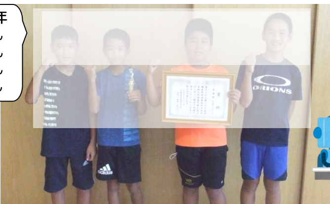
6年 さん さん さん さん