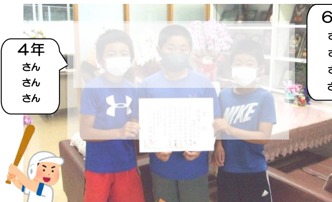
4年 さん さん さん