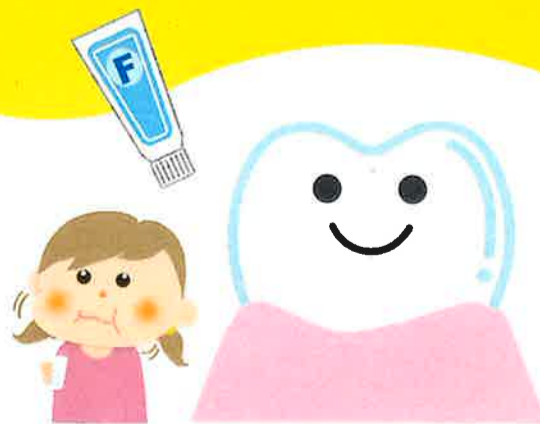
フッ素塗布やフッ素洗口、フッ素入り歯みがき剤で 歯を強くし、むし歯から歯を守る

毎日の仕上げみがき時にフッ素入り歯みがき剤等を使用すると、使用しない場合に比べ、有意にむし歯になりにくいことがわかっています。(親子で歯っぴ〜プロジェクト事業報告書)