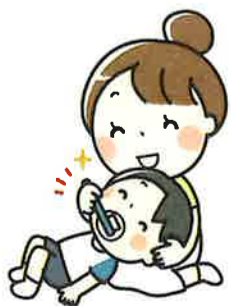
大人による仕上げみがき 寝かせみがき・立たせみがき・後ろ立たせみがき

むし歯予防には「小学4年生頃までの大人による仕上げみがき」と「フッ素の利用」が効果的です。